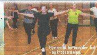
Bymæssigt for muskler, led og kropstræning.

Øvelser til træning af krop og hjerne m.m. Alle øvelser kan laves i din stue og træner netop, hvor du har dit specielle behov.