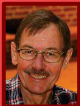
S1 + S2