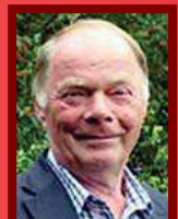
T1 + T2