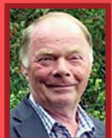
T1 + T2