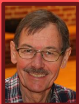
S1 + S2