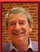
T1 + T2